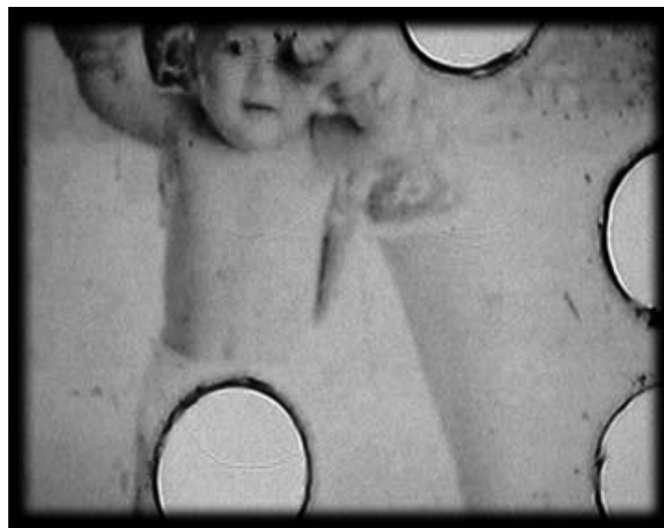
Yoame Escamilla / Fotograma Super 8mm. Post Mortem 3 / 2005