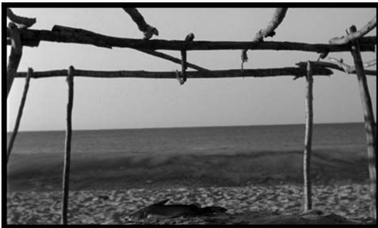
Yoame Escamilla / Fotograma Post Mortem 5 / 2005