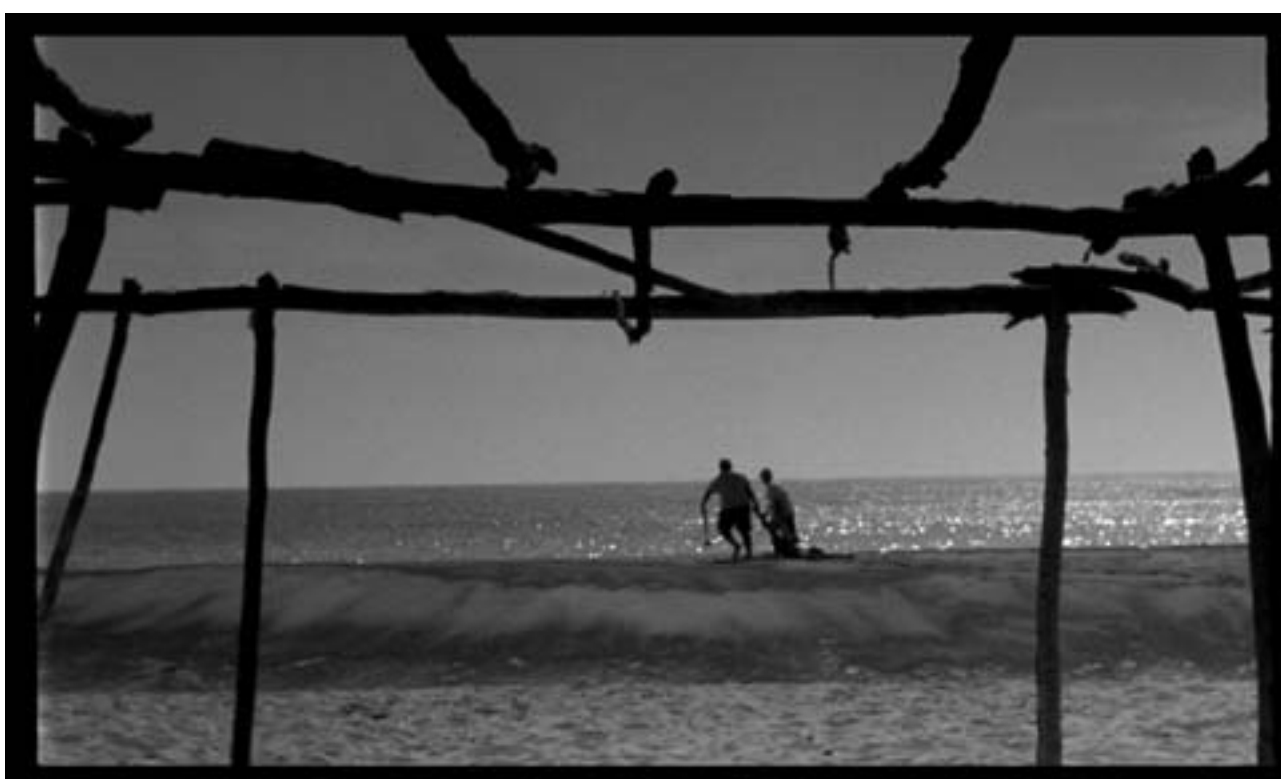
Yoame Escamilla / Fotograma Post Mortem 6 / 2005

Amanece en el lago La luz hace una incisión sobre el abdomen del hielo Pus de cristal recién drenada ◇