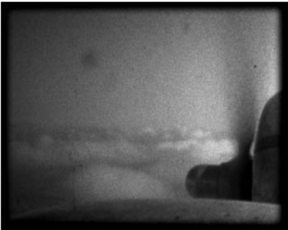
Yoame Escamilla / Fotograma Super 8mm. Post Mortem 1 / 2005

Cuando alguien intenta explicar que ha percibido algo inexpresable, alrededor se generan tres tipos de atención: la complaciente, la escéptica y la de la complicidad. La primera generalmente, frena el intento comunicativo debido a que antepone el ego del receptor como origen del vínculo; el escéptico, en cambio, da posibilidades mayores de comprensión sólo si la idea tiene matices de probabilidad, es decir, que no sea tan inexpresable. El único capaz de acceder en mayor proporción a lo que no puede expresarse con símbolos, es quien también lo ha percibido. Pero en ese caso, la comunicación sólo podría darse parcialmente, debido a que lo inexpresable es también infinito. ◇