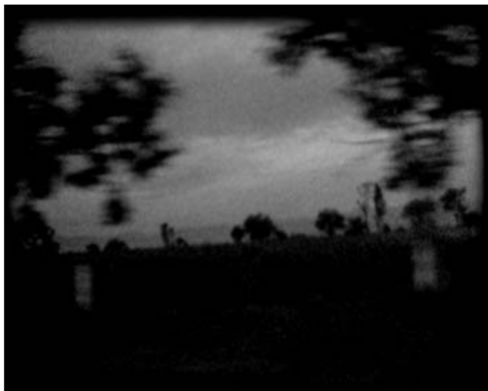
Yoame Escamilla / Fotograma Post Mortem 1 / 2005

Los gatos juegan destruyen telarañas entre las plantas. ◇