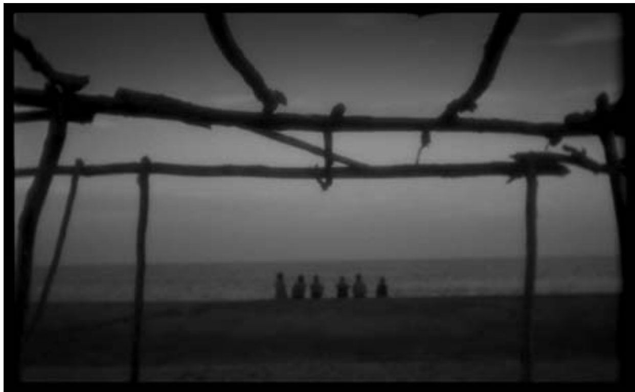
Yoame Escamilla / Fotograma Post Mortem 7 / 2005

los llantos quebrados caían como escombros trágicos en todo el edificio, y se escucharon las amenazas de un sujeto fuera de sí que gritaba frente a mi esposa y mis hijos, pero yo ya estaba oculto de la película. ♦