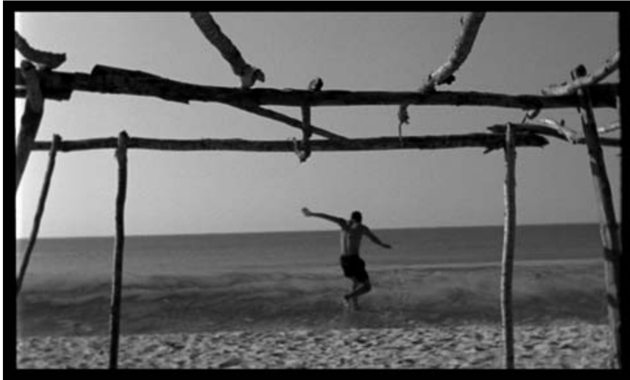
Yoame Escamilla / Fotograma Post Mortem 8 / 2005

La madrugada es un gran gnomo que herido por los latigazos del sol se recuerda bien/ es como lo veían mis ojos desvelados/ corriendo en lo oscuro/ cuando poco a poco se tejía este poema ◇