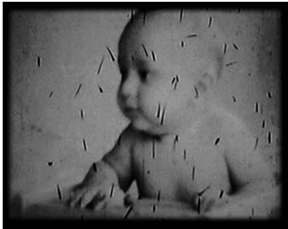
Yoame Escamilla / Fotograma Super 8mm. Post Mortem 2 / 2005

Alabadas sean las obras de los hombres sobre la tierra. ♦